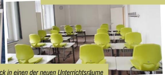
Blick in einen der neuen Unterrichtsräume