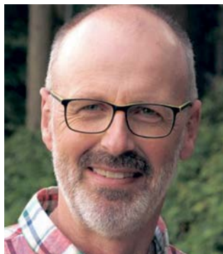
„Die Erholungs- und Tourismusindustrie, die blühen auf. Ein Nationalpark schafft Arbeitsplätze. In Euros ausgedrückt ist das ein Hochleistungsbetrieb...“ - Peter Wohlleben