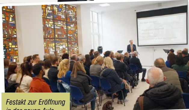
Festakt zur Eröffnung in der neuen Aula

Von der Idee eines Oberstufen-Campus bis zu dessen Realisierung hat es nur ein Jahr gedauert, für ein öffentliches Vorhaben ist dies sicherlich eine Rekordzeit. Neben dem Kolping-Kindergarten ist der Oberstufen-Campus nun schon der zweite Mieter in dem historischen Gebäude, dem lange der Abriss drohte. Doch nun kommt alles anders. Im nächsten Bau- und Sanierungsabschnitt sollen Wohnungen für Mitarbeiterinnen und Mitarbeiter des MZG folgen. Damit belebt sich das altehrwürdige, knapp 300 Meter lange Sanatorium immer weiter. Der Vorsitzende des Bad Lippspringer